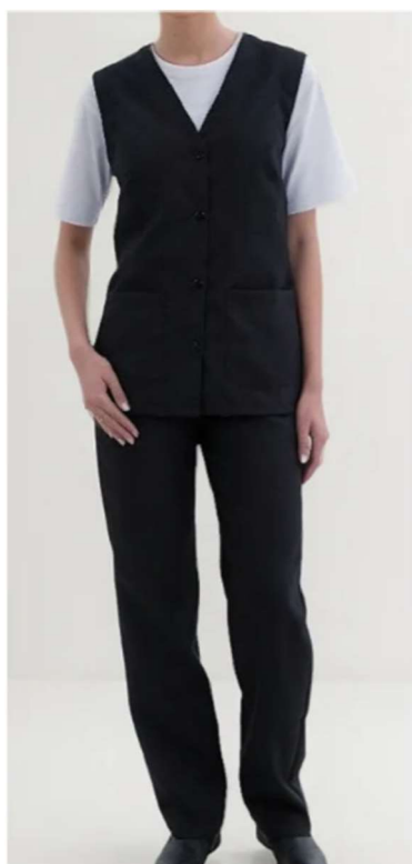
Figura 1- Referência 1

5.11.1.4. Calçado fechado, antiderrapante e adequado às normas de segurança do trabalho.